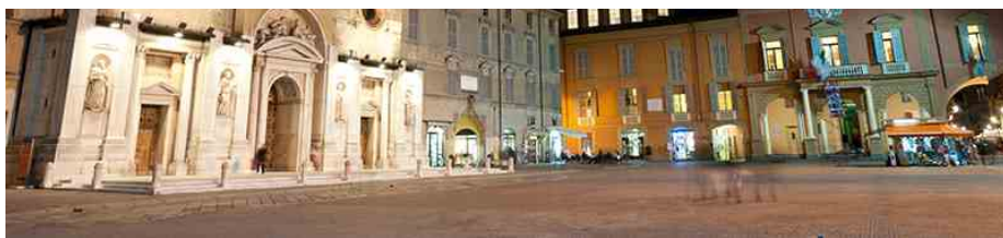
night view of Cathedral and city hall in Reggio Emilia

La Storia di Reggio Emilia (Typimedia Editore, 208 pag, € 14,90) è disponibile in libreria e in edicola. È inoltre possibile acquistare il libro online sul sito www.typimediaeditore.it .