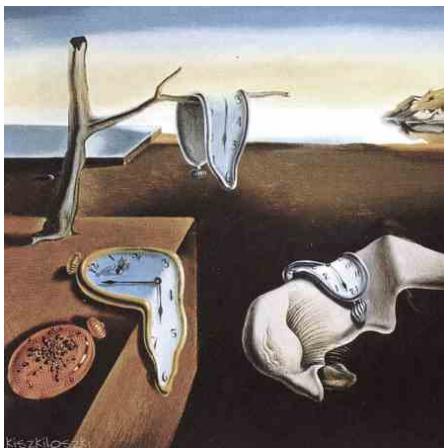
CORRETE A VISITARLI, PRIMA CHE IL CALDO FACCIA SCIOGLIERE LE OPERE!

Per le visite guidate invece è obbligatoria la prenotazione utilizzando il link: https://biglietti-palazzo-dei-musei-giornate-inaugurali.eventbrite.it oppure telefonando al numero 0522.456816.