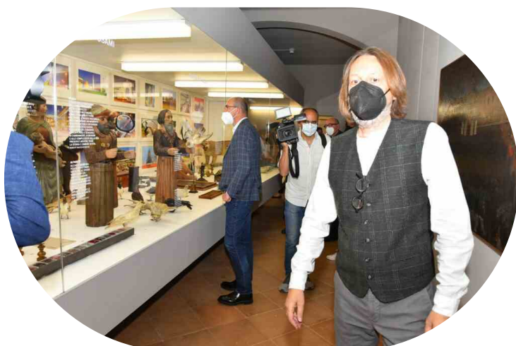
REGGIO INAUGURAZIONE NUOVO PALAZZO DEI MUSEI

Per le visite guidate invece è obbligatoria la prenotazione utilizzando il link: https://biglietti-palazzo-dei-musei-giornate-inaugurali.eventbrite.it oppure telefonando al numero 0522.456816.