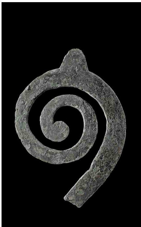
Lituo sacro etrusco (collezione Chierici)